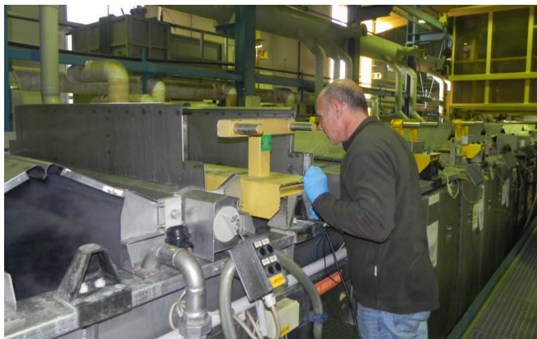
Le groupe a investi plusieurs centaines de milliers d'euros dans son unité haut-savoiarde pour améliorer l'outil de production.